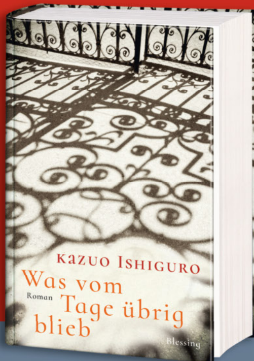
Gebunden | € 20,- [D] | ISBN 978-3-89667-631-3