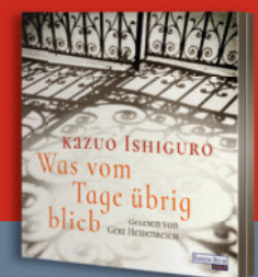
Ab Dezember auch als Hörbuch bei Random House Audio